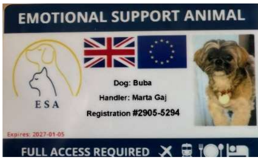
Bild 4 Ausweis ESA von Buba

Buba gehört zur Hunderasse Shih Tzu, die besonders für Allergiker geeignet ist. Außerdem ist Buba ein zertifizierter „ ESA (Emotional Support Animal) “.