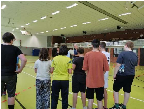
Bild 13 Siegerehrung Basketballturnier

Das sportliche Angebot umfasst verschiedene Disziplinen, insbesondere Fußball, Basketball sowie Brennball . Die Turniere werden jahrgangsbezogen organisiert, wobei die Klassenstufen 5 bis 7 sowie die Klassenstufen 8 bis 10 jeweils untereinander antreten.