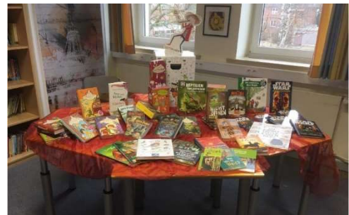
Bild 14 Neuanschaffung für Schulbücherei

In der Pestalozzischule ist im 1. Obergeschoss die schuleigene Bücherei zu finden. Unsere Bücherei ermöglicht es allen Kindern der Schule ohne große Hürden den Zugang zu mehr als 3000 Büchern aus unterschiedlichen Bereichen (Sachbücher, Kinderbücher, Comics etc.) zu erhalten. Die Bücherei wird von einem ehrenamtlichen Mitarbeiter, der über die Agentur KELLU zu uns gekommen ist, betreut und ist einmal pro Woche geöffnet. Sie kann aber auch nach Absprache in der großen Pause oder