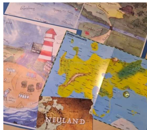
Bild 11 Arbeit mit Befindlichkeitskarten und Inneren Landkarten

Unsere systemische Beratung ist geleitet von Ressourcenaktivierung, Wertschätzung und Lösungsorientierung. Sie verpflichtet sich zu Neutralität und verzichtet auf jede Art von Schuldzuweisung. Ein großer Methodenpool von systemischen Techniken lässt so bisheriges dysfunktionales Verhalten neu betrachten.