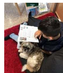
Bild 3 Buba hilft beim Lesen

In unserer Schule sind zurzeit zwei Hunde , Buba und Tilda, eingesetzt. Der Aufenthalt von Hunden in den Klassen erfordert besondere Verhaltensregeln und fördert eine emotionale Unterstützung für die Schülerschaft (s. dazu ausführlich Konzept Hundgestützte Pädagogik).