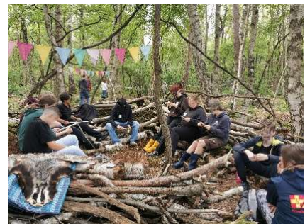
Bild 9 Thema Wald auf dem Kudammhof

An der Pestalozzischule Celle kommt der Einbindung außerschulischer Lernorte im Rahmen eines ganzheitlichen Bildungsverständnisses eine besondere Bedeutung zu. Durch die gezielte Nutzung regionaler Angebote werden Unterrichtsinhalte praxisnah vertieft und die Lernenden in ihrer individuellen Kompetenzentwicklung nachhaltig unterstützt.