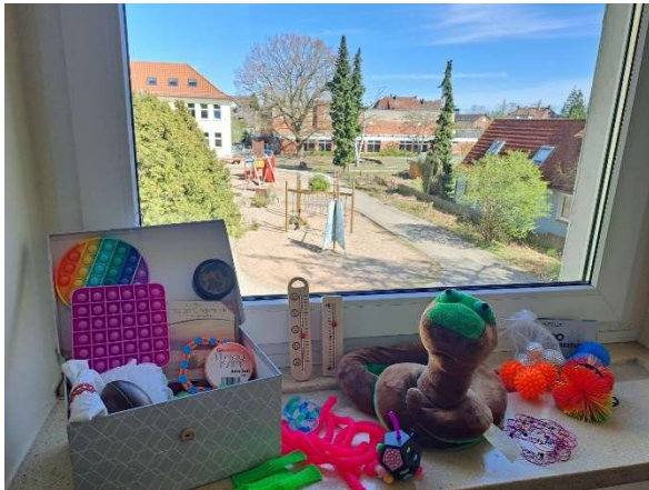
Bild 8 Skillskisten in jeden Raum vorrätig

Skill-Kisten mit verschiedenen Beruhigungs- und Fokussierungsteilen bieten wir auch an.