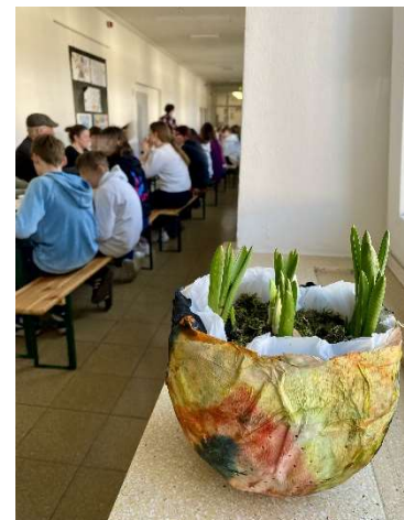
Bild 15 Schulfrühstück

(Kauf der Lebensmittel, Vorbereitung der Lebensmittel und Dekoration, Auf- und Abbau der Tische und Stühle im Flur des Erdgeschosses, Anrichten des Buffets, Reinigung).