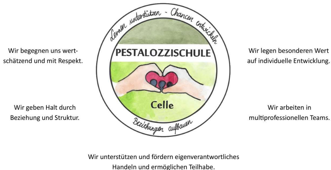
Bild 1 Leitbild der Pestalozzischule

Mit der Einführung des Förderschwerpunktes im Bereich der emotionalen und sozialen Entwicklung wurde das Leitbild und das Schulprogramm der Pestalozzischule evaluiert und vollkommen neu aufgestellt.