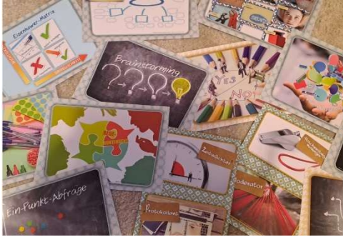
Bild 12 Methodenkarten zur Teamreflexion und Kollegialen Fallberatung

Unsere multiprofessionellen Teams begeben sich regelmäßig in Reflexionsgespräche und betrachten die Entwicklung der Schüler*innen in klaren Abläufen von kollegialer Beratung.