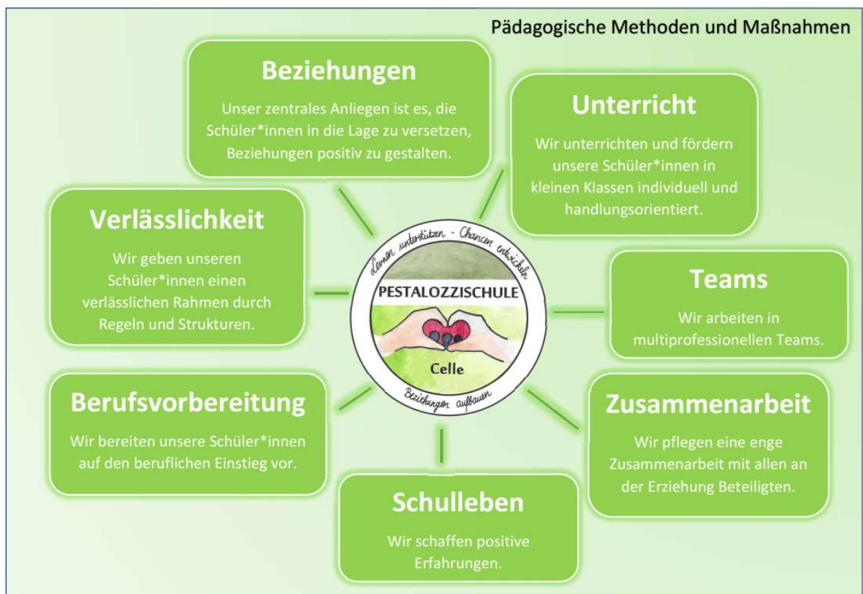
Bild 2 Pädagogische Methoden und Maßnahmen