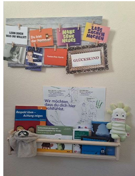
Bild 10 Team der Schulsozialarbeit – Zeit für Gespräche und Beratung

Im Team der Schulsozialarbeit sind vier pädagogische Mitarbeiterinnen als Fachkräfte für unterrichtsbegleitende Tätigkeiten und außerunterrichtliche Angebote angestellt. Ihr Ziel ist es, als integrative und unterstützende Instanz im schulischen Alltag zu wirken. Im Fokus stehen die Förderung eines positiven Schulklimas, die Stärkung der Persönlichkeitsentwicklung von unseren Schüler*innen, die Unterstützung bei der individuellen Lebensbewältigung sowie die Entwicklung realistischer Zukunftsperspektiven. Darüber hinaus werden Ressourcen aktiviert und die Selbstwirksamkeit der Schüler*innen gestärkt. Das Team der Schulsozialarbeit leistet somit einen wesentlichen Beitrag zur ganzheitlichen Entwicklung der Schüler*innen der Pestalozzischule Celle. (s. dazu ausführlich Konzept „Schulsozialarbeit“ der Pestalozzischule Celle)